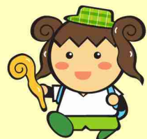
御杖村の「つえみちゃん」

キャンプはもちろんフィールドアスレチックや、アマゴ釣り、川の滑り台など様々な楽しめます。